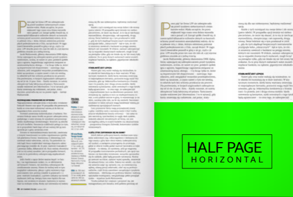
1/2 strony – poziom 210x135 mm + spady 5mm