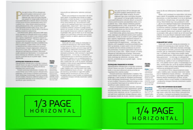
1/3 strony 210x90 mm + spady 5mm